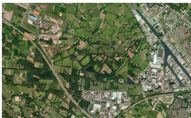
Stedelijke uitbreidingen in een gaaf landschap (Twekkelo).